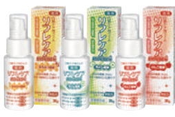
薬用 口腔ケア用ジェル リフレケア