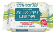
口腔清拭シート リフレケアW