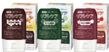
薬用 口腔ケア用ジェル リフレケア

ケアの語源は「思いやり」です。しかし認知症ケアの中で、「食の楽しみ」を考えることはあっても「健やかな口腔」を考えることが案外少ないのではないのでしょうか。いま、毎日歯みがきをしている貴方が、今後もし、歯みがきをできない状態になったら、自分だったらどうしてほしいですか？ 誤嚥性肺炎は口腔の健康を失った先にある結果のひとつです。ほかに、スムーズな会話、美味しく楽しい快適な食生活などその人らしい生活を損なう事象が起こります。認知症の方の症状の背景にあるものが何かを推し量り、そのうえで食と口腔の支援を適切に行うために何が必要か一緒に考えてみませんか。